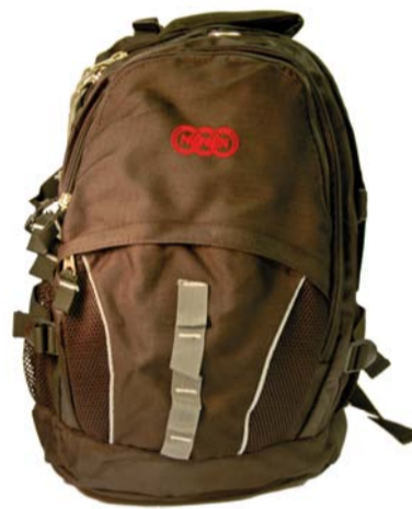
Sporty tursekk med regntrekk