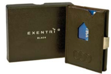
Kortholder i skinn