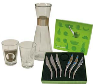
Rosendahl vannkaraffel. Leveres med 2 glass eller Hardangerkniver